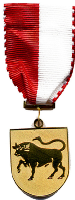
Medalj nr 79 framsida