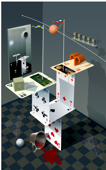
© Björn Carlen: BALANS AKT PÅ SLAK LINA (STEREO), Digital Painting, 949x595 + 949x595 mm